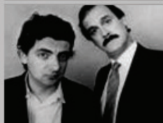
John Cleese i Rowan Atkinson tijekom provoda.